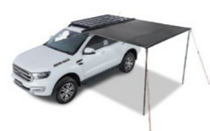
SUNSEEKER 2.5M AWNING サンシーカー オーニング 2.5m 品番: 32133 参考定価: ¥48,000