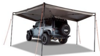
BATWING AWNING (LEFT) バットウイング オーニング(左) 品番: 33100 参考定価: ¥140,000

バットウイング オーニング / サンシーカー 2.5 M はランドクルーザー、プラドなどボリュームのある SUV にぴったりのサンシェード。車体の大きさを活かして、広々としたスペースを確保できるからゆったりくつろげます。オプションのエクステンションを組み合わせれば、プライバシー・セキュリティ対策にも。